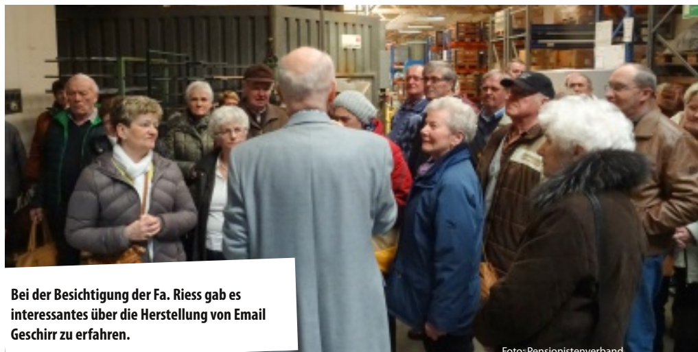
Bei der Besichtigung der Fa. Riess gab es interessantes über die Herstellung von Email Geschirr zu erfahren.

Auch unsere Wandertruppe hat sich wiedereinander zusammengefunden. Mit 20 Personen starteten sie vom Parkplatz des Restaurants Schmankerl in Schwanenstadt zu einem Marsch rund um Schwanenstadt. Wir sind rausgegangen zur Agerau, entlang des Flusses bis Neudorf und über die Ortschaft Staig rauf bis zur