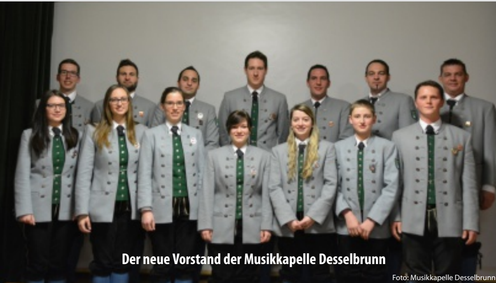
Der neue Vorstand der Musikkapelle Desselbrunn