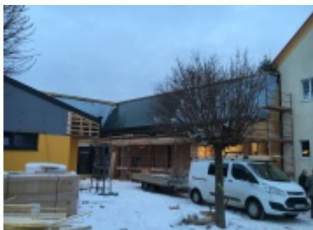
Kindercampus neu - Ansicht des neu errichteten Rohbaues bei der Gleichfeier