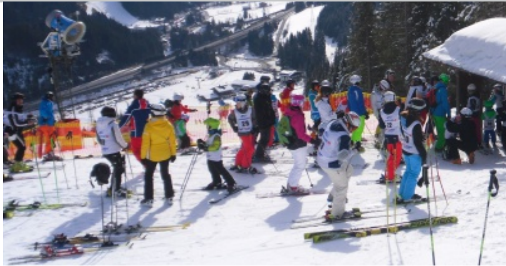
Viele der angereisten Starter vor dem Starthaus in Flachauwinkel.