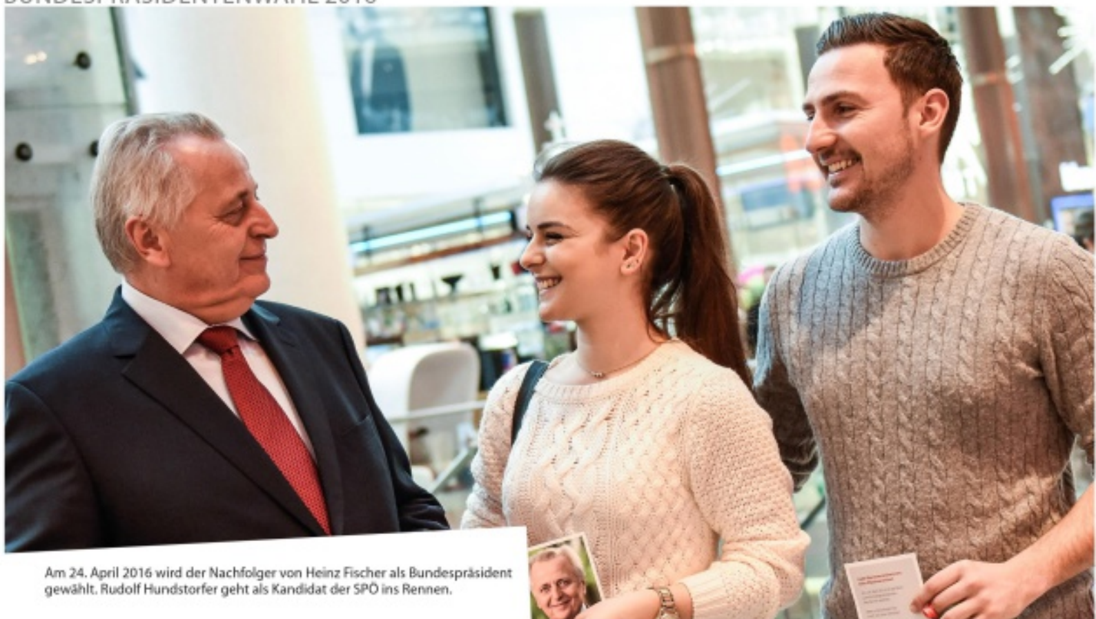
Am 24. April 2016 wird der Nachfolger von Heinz Fischer als Bundespräsident gewählt. Rudolf Hundstorfer geht als Kandidat der SPÖ ins Rennen.

Rudolf Hundstorfer will als Bundespräsident ein Vermittler sein, der auf ein respektvolles Miteinander setzt