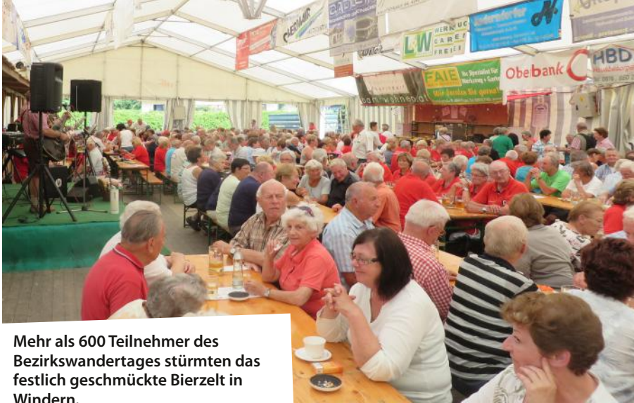
Mehr als 600 Teilnehmer des Bezirkswandertages stürmten das festlich geschmückte Bierzelt in Windern.