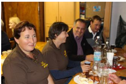
Die Ortsbäuerinnen sorgten für Speis und Trank.