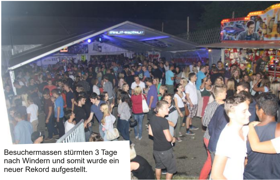
Besuchermassen stürmten 3 Tage nach Windern und somit wurde ein neuer Rekord aufgestellt.

Die Feuerwehr Windern wurde in den Sommermonaten zu 5 großen Einsätzen alarmiert. Neben 3 Brandeinsätzen: AVE Redlham, KFZ-Brand in Viecht und Feldbrand in Mitterberg wurde die Wehr auch zu einer Fahrzeugbergung in Viecht und zu einem tragischen Verkehrsunfall in Bubenland gerufen. Weiters standen 3 Übungen sowie die Grundlehrgangsvorbereitung auf dem Programm. Aber auch für Spaß und das Feiern bleib im Sommer ein bisschen Zeit. Für das Feiern musste zuerst viel gearbeitet werden, so wurden für das Zelfest insgesamt ca. 5.500 Stunden aufgewendet. Nach dieser gelungenen jedoch sehr arbeitsintensiven Festwoche wurde trotz dem mäßigen Wetter der Sommer genossen. Sportliche Aktivitäten, die Feier der Jugendgruppe und schließlich die Cold Water Challenge prägten die Sommermonate!