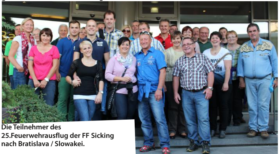
Die Teilnehmer des 25. Feuerwehrausflugs der FF Sicking nach Bratislava / Slowakei.

Auch wir haben uns mit diesen Thema auseinandergesetzt, auch aufgrund unserer Nominierung. Wir diskutierten und kamen zum Entschluss aus mehreren Gründen nicht teilzunehmen. Aufgrund der derzeitigen Witterungsverhältnisse, Regen (Hochwassergefahr) würde es einer Verhöhnung unserer Bewohner entlang der Aurach gleich kommen etwas in der Aurach zu unternehmen. Auch ist es unverantwortlich als Körperschaft des öffentlichen Rechts mit unseren Gerätschaften, welche für Übungen und Einsätze angeschafft wurden, an so einer Aktion teilzunehmen. Da wir aber gestern eine Übung abhielten die „nass“ durchgeführt wurde kann man ja auch behaupten wir haben unsern Teil erfüllt, da ja „Cold Water Challenge“ frei übersetzt „Herausforderung mit kaltem Wasser“ heißt.