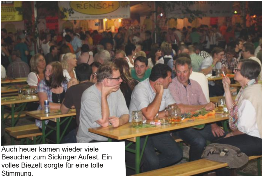
Auch heuer kamen wieder viele Besucher zum Sickinger Aufest. Ein volles Bierzelt sorgte für eine tolle Stimmung.