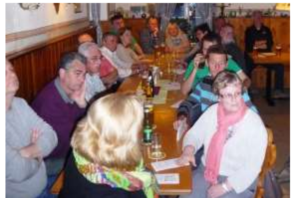
Die interessierten BürgerInnen bei der 17. Veranstaltung vor Ort im Gasthaus Übleis

Gezieltes Arbeiten vor Ort mit Themen die die BürgerInnen einbringen können und Informationen darüber bekommen, was mit ihren Anliegen geschehen ist.